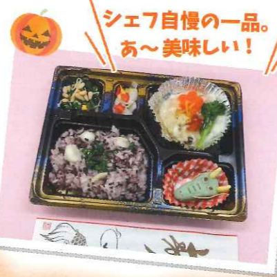
シェフ自慢の一品。 あ〜美味しい!