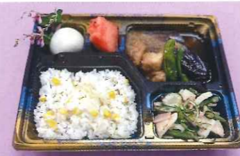
秋のぎんなん御膳