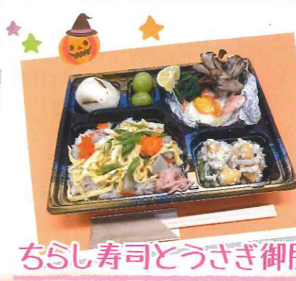
ちらし寿司とうさぎ御膳