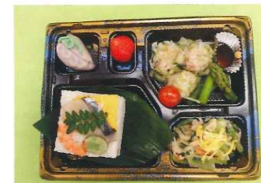
さわらの押し寿司御膳